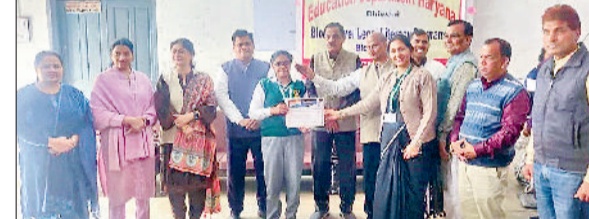
हरिभूमि न्यूज ▶▶ भिवानी

दिल्ली वर्ल्ड पब्लिक स्कूल, भिवानी के छात्रों ने सरकार हरियाणा द्वारा आयोजित स्टूडेंट्स लीगल लिटरेसी प्रोग्राम के तहत हुई विभिन्न प्रतियोगिताओं में शानदार प्रदर्शन कर विद्यालय का नाम रोशन किया है। इस कार्यक्रम के अंतर्गत आयोजित प्रतियोगिताएं विद्यार्थियों में कानूनी जागरूकता, अभिव्यक्ति कौशल तथा तर्कशक्ति को बढ़ावा देने पर केंद्रित थीं।