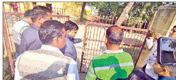
बाढ़ड़ा। शिक्षा विभाग द्वारा मांगे मानने पर स्कूल के मुख्य द्वार से तालाबंदी हटाते आंदोलनकारी पंचायत प्रतिनिधि व बीईओ जलकरण।