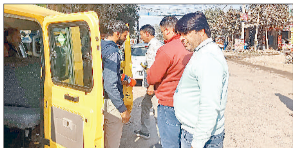
चरखी दादरी। स्कूल बस की जांच करते सीएम फ्लाइंग अधिकारी।