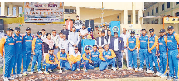
भिवानी। विजेता टीम को ट्राफी देकर सम्मानित करते हुए।