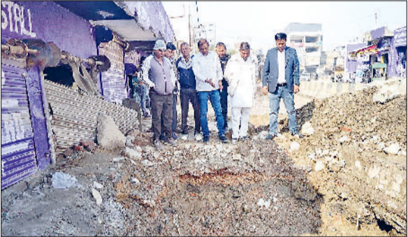
भिवानी। खराब वॉल्व की जानकारी देते पार्षद व पाइप लाइन में लीकेज को दुरुस्त करने के लिए खोदी गई सड़क।