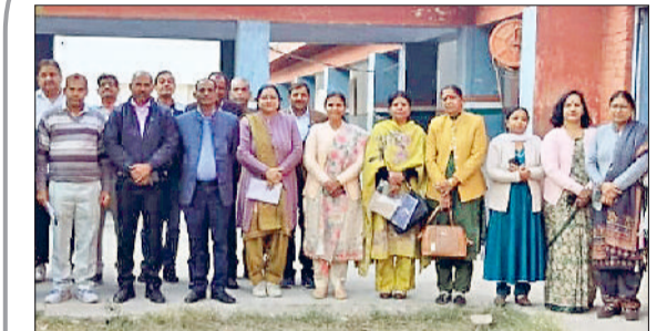
बवानीखेड़ा। प्रशिक्षण कार्यक्रम में उपस्थित शिक्षक व अन्य।