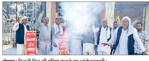
तोशाम। बिजली बिल की प्रतियां फूंकते हुए आंदोलनकारी।

ऑल इंडिया किसान खेत मजदूर संगठन के कार्यकर्ता और समर्थकों ने बीज विधेयक 2025 को वापस लेने तथा बिजली क्षेत्र को प्राइवेट हाथों में देने के बिजली संशोधन बिल 2025 को निरस्त करने की मांग को लेकर शुक्रवार को तोशाम नई अनाज मंडी में दोनों बिलों की प्रतियां जलाईं।