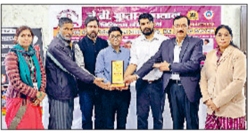
भिवानी। कार्यक्रम में मुख्य अतिथि को सम्मानित करते हुए।