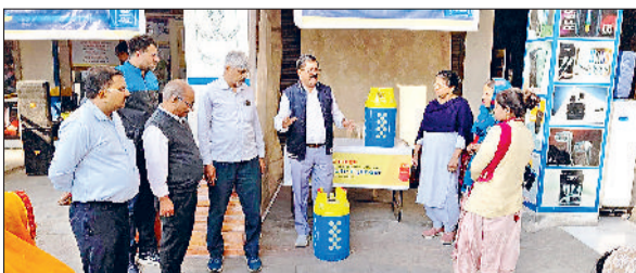
भिवानी। नए सिलेंडर के बारे में जानकारी देते हुए।

रसोई गैस उपभोक्ताओं के लिए एक बड़ी राहत भरी खबर है। भारी-भरकम और जंग लगने वाले लोहे के सिलेंडरों के दिन अब लदने वाले हैं। भारत पेट्रोलियम कॉर्पोरेशन लिमिटेड की भारत गैस ने अपने ग्राहकों के लिए आधुनिक तकनीक से बने कंपोजिट सिलेंडर का विकल्प पेश किया है। आम भाषा में लोग इसे प्लास्टिक का सिलेंडर कह रहे हैं, लेकिन वास्तव में यह उच्च गुणवत्ता वाले फाइबर और पॉलीमर से बना बेहद सुरक्षित सिलेंडर है। शुक्रवार को स्थानीय इंप्रूवमेंट मांटेड स्थित ओम गैस सर्विस पर उज्ज्वला योजना व सिलेंडर स्वीपिंग के तहत कार्यक्रम का आयोजन